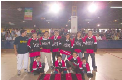
Campeonato Infantil en Sevilla(2005)