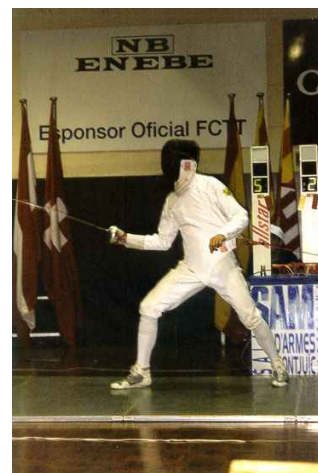
El esgrima pasa por ser un de los deportes más elegantes e interesantes

SPV: ¿Qué diferencias hay entre la esgrima femenina y la masculina?